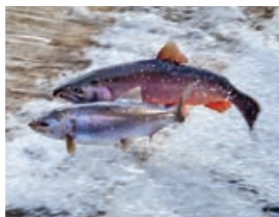
Wenn Lachse wählen könnten