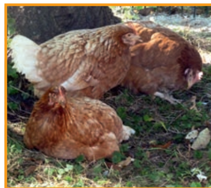
Fundtiere der besonderen Art