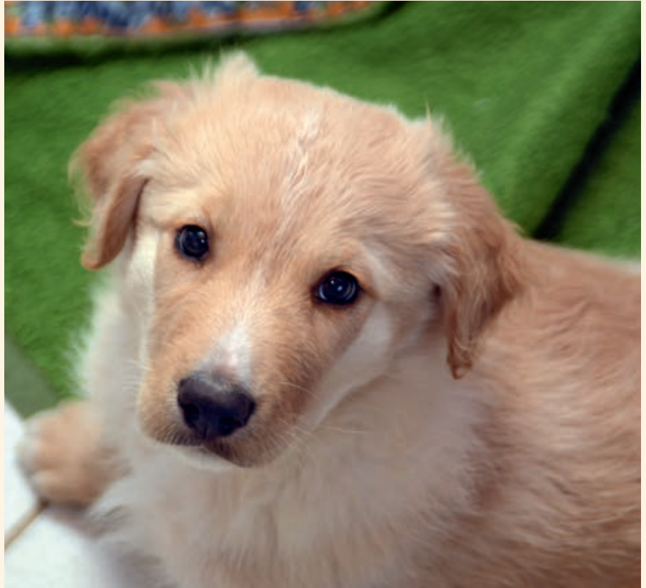
Ob jung oder alt, im Tierheim werden alle Tiere versorgt

wurden im System Kreistierheim und vom Tierschutzverein Mechernich 89 Hunde, 278 Katzen, 13 Kaninchen, fünf Chinchillas, fünf Meerschwein-