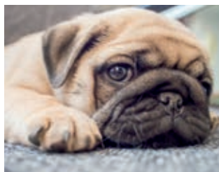
Wer schön sein soll, muss leiden – Qualzucht für den Modetrend