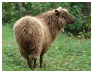
Hunde, Katze, Schaf – das Tierheim Mechernich