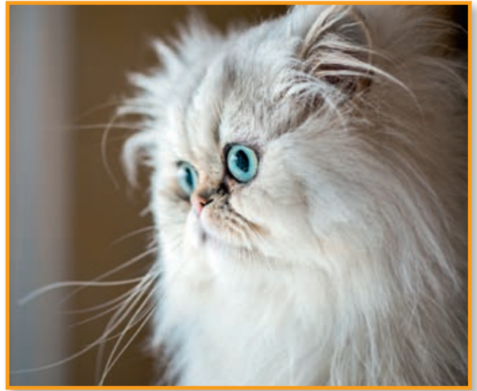
Die kurze Nase – Sinnbild für die Perserkatze