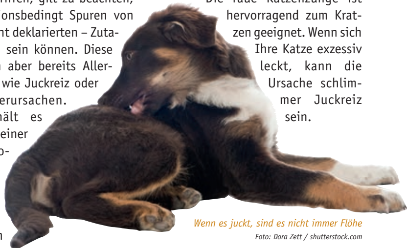
Wenn es juckt, sind es nicht immer Flöhe

Die raue Katzensprache ist hervorragend zum Kratzen geeignet. Wenn sich Ihre Katze exzessiv leckt, kann die Ursache schlimmer Juckreiz sein.