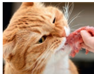
Die große Frage: Leidet mein Tier an einer Futtermittelallergie?