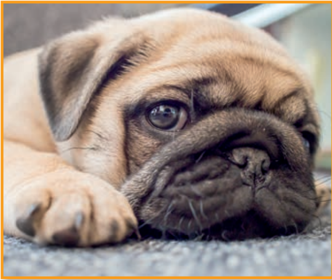
Zu große Augen, zu kurze Nase – nur weil es gefällt