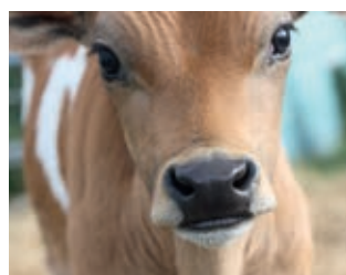
20 Minuten Warten auf den Tod ▶ 8