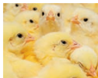
Wenn Küken Abfall werden ▶ 12