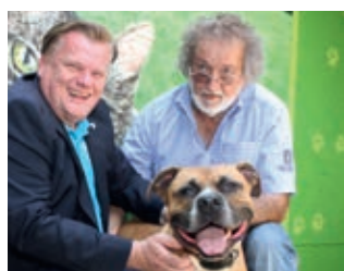
Der Präsident zu Gast im Tierheim ▶ 6