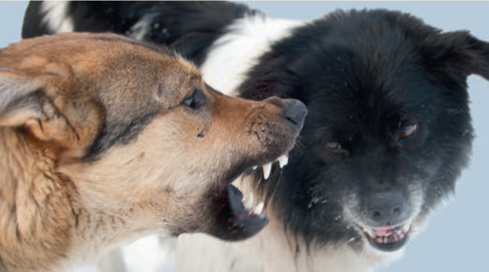
Vor Verletzungen ist niemand gefeit