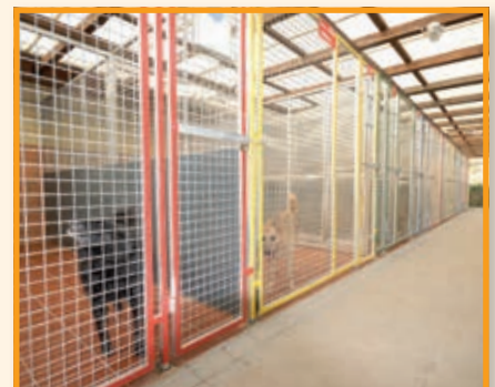
Katze, Hund und Co finden Aufnahme im Kreistierheim Mechernich