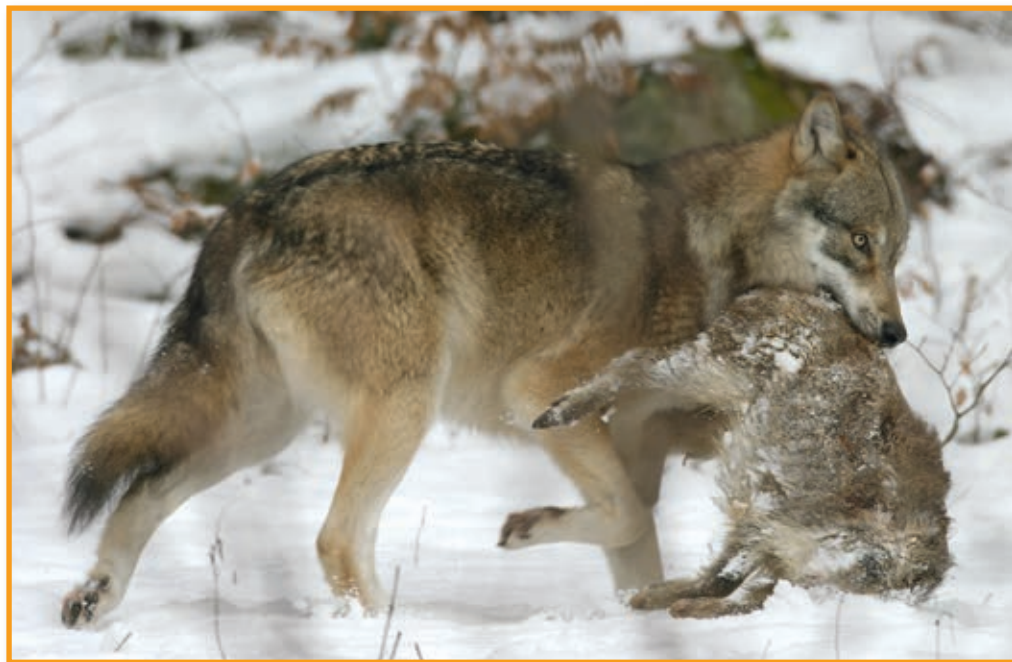
Die Sorge der Jäger: Konkurrenz durch den Wolf