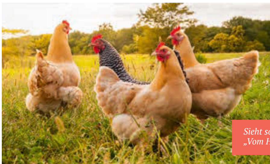
Sieht so die Zukunft der Hühnerhaltung aus? „Vom Hof auf den Tisch“ setzt neue Zeichen.

Ein starkes Papier, am Ende ein letzter Strohalm auf dem ausdörrenden Acker. Oder ist es nur heiße Luft, die sich, wie in den Jahrzehnten zuvor, mit Alibi-Politik wieder abkühlen lässt? Anscheinend nicht, denn „die Kommission wird sicherstellen, dass diese Strategie in enger Verbindung mit den anderen Elementen des Grünen Deals umgesetzt wird“. Eine klare Ansage in der Mitteilung an Rat, Parlament und Öffentlichkeit. Eine ohne Floskeln oder Wenn und Aber. Auch wenn jüngst im Rahmen der Haushaltsverabschiedung der EU die alten Lobbyisten und Politiker von gestern einen Agrarhaushalt mit Schwerlast für „weiter so“ verabschiedeten, ist der Wandel nicht mehr aufzuhalten. Helfen wir ihr bei der Umsetzung, es wird nicht unser Schaden sein!