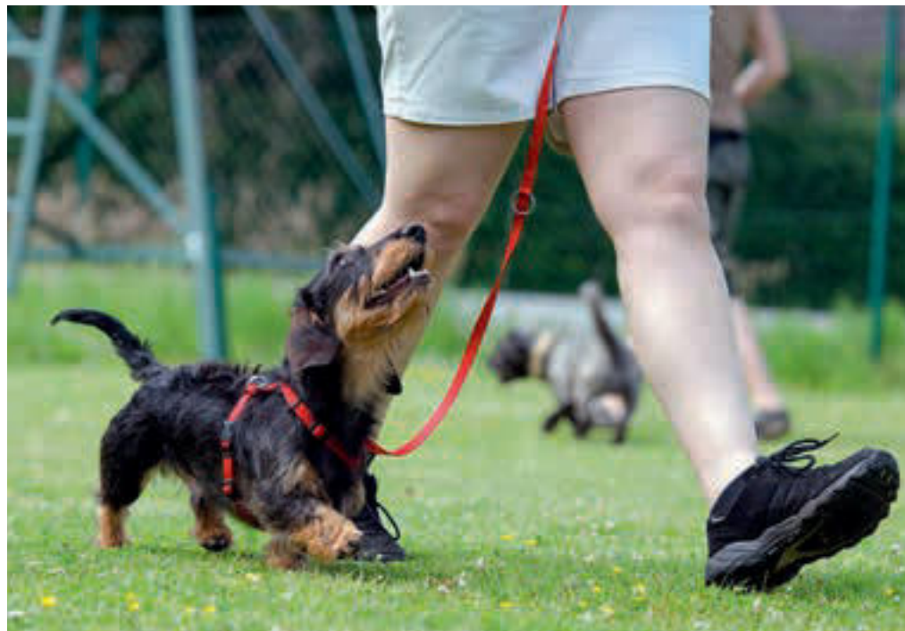
Das positive Zusammenspiel zwischen Hund und Mensch soll in der Hundeschule gefördert werden.

Erfüllt die gewählte Hundeschule diese Kriterien nicht, so sollten Sie sich mit ruhigem Gewissen auch nach anderen umsehen. Denn Erfolg lässt auf sich warten, wenn diese Dinge nicht erfüllt werden. Das alles kann mitunter ein langwieriger und zeitaufwendiger Prozess sein. Doch was ist schon die vermeintlich lange Suche nach einer Hundeschule verglichen mit einem harmonischen Leben von tierischem Begleiter und Halter?