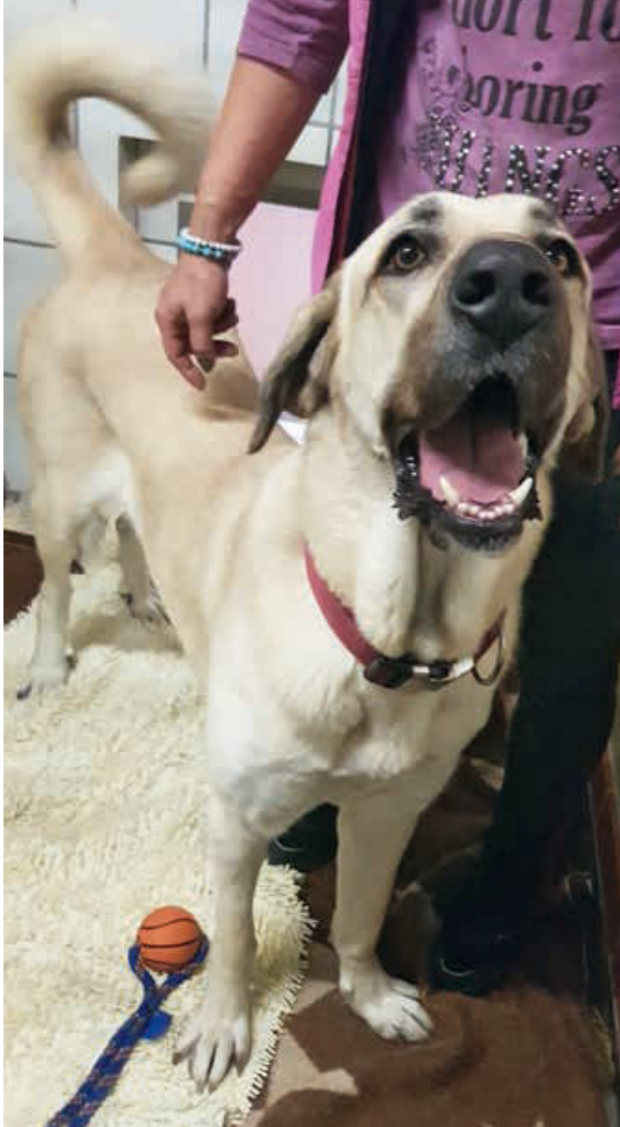
Shela sucht noch dringend ein liebevolles und artgerechtes Zuhause.

Geben Sie diesen „Notfellen“ eine Perspektive. Sie haben es verdient, eine echte Chance zu bekommen. Eine echte Chance, Hund sein zu dürfen.